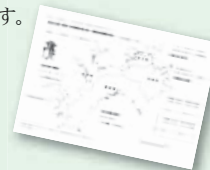
▲歩行マップ「四国お遍路の道」も記録用紙と併せて配布しています。目標にいかがですか。

このキャンペーンは指定の記録用紙に、毎日の歩数を記録し30万歩を一口として、応募するものです。