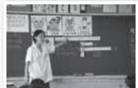
▲苦手な牛乳には栄養たっぷり!? 「好き嫌いをなくそう」(富里第一小2年)