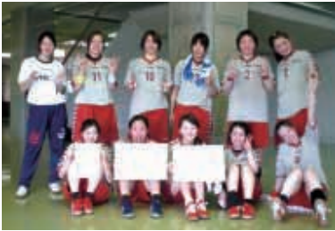
▲日吉台クラブの皆さん

7月13・15日に第32回全国クラブハンドボール選手権大会東地区大会が福島県本宮市で開催されました。 市内からは、6月に開催された関東大会で第3位の成績を収めた「日吉台クラブ」が、この大会に出場。 東日本の各地区から代表チームが出場し、トーナメント方式で順位を競い合いました。日吉台クラブは、初出場ながら決勝戦まで駒を進め、準優勝に輝きました。