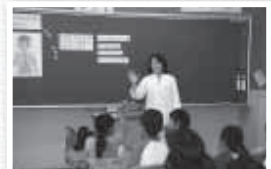
▲糖分を取り過ぎていないかな? 「生活習慣病の予防」(富里小4年)