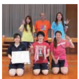
▲バドミントン女子(右)の皆さん