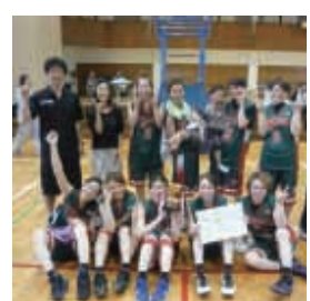
▲優勝したバスケットボール女子