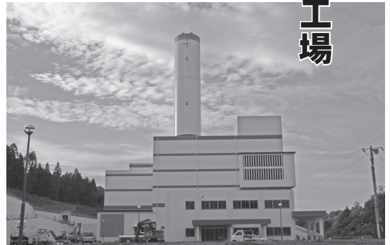
▲10月の本格稼働開始を目指し、工事が進んでいます

市では、現在のクリーンセンター焼却施設の老朽化に伴い、新たな焼却施設「成田富里いずみ清掃工場(成田市小泉344番地1)」の建設を成田市と共同事業として進めています。平成21年度から新清掃工場建設工事に着手し、平成24年10月の稼働を予定しています。