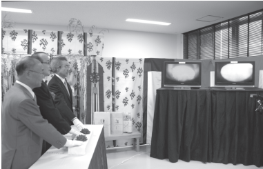
▲火入れの起動スイッチを押す相川市長(左)

発行●富里市 編集●富里市総務部秘書広報課 〒286-0292 千葉県富里市七栄 652 番地 1 TEL●0476 (93) 1111 (代) FAX●0476 (93) 9954 発行日●7月15日(毎月2回発行) ●富里市ホームページアドレス http://www.city.tomisato.lg.jp/ ●電子メールアドレス info@city.tomisato.lg.jp