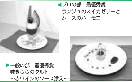
プロの部 最優秀賞 ランジュのスイカゼリーと ムースのハーモニー

レシピは、市ホームページで公開しているほか、産業経済課でも窓口で配布しています。