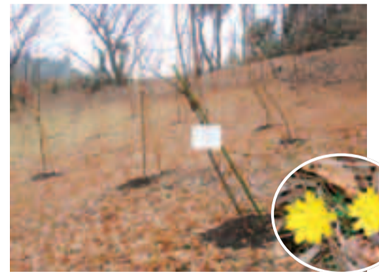
▲「福寿草」は、県内では、富里市と成田市のみでしか自生が確認されていない希少種です。

「緑の募金」とは、緑を未来に引き継ぐための運動で、皆さんからの募金がさまざまな緑化事業に役立られています。