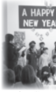
▲日ごろの学習の成果をニューイヤーパーティーで披露