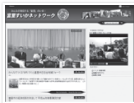
◀ホームページには富里の情報が満載！

HP http://tomisato-suika.net/ ☎ joho@tomisato-suika.net