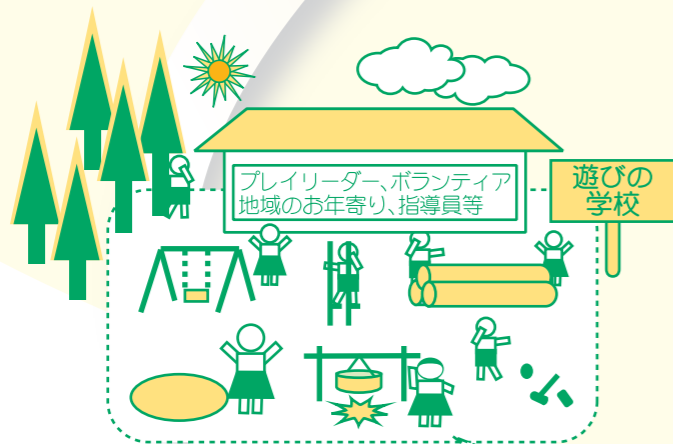
(参考イメージ) 子どもが主体的に活動できる居場所づくり