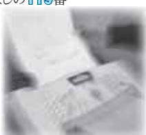
▲あてずじままの「119」番へ