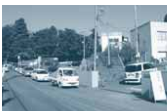
▲センター前の道路は大混雑！

富里市は、家庭用ごみを直接クリーンセンターに搬入する車が、近隣市町村から比べても非常に多い市です。最近、その搬入待ちの車で平日でもセンター前の道路が渋滞し、交通の妨げになっています。また、このことが原因で、ごみ収集業務が遅れたり、見