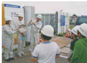
▲模型を使って耐震構造を説明

市では、8月の完成を目指し、浩養小学校体育館の耐震補強工事を実施しています。5月28日に、浩養小学校5、6年生の児童が、自分たちの体育館の工事現場を見学しました。