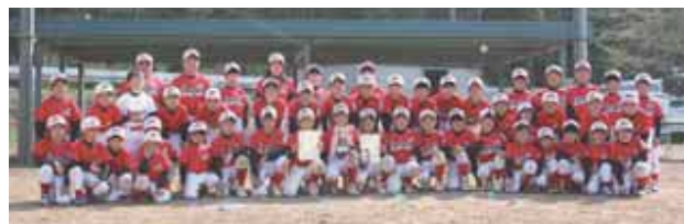
▲ラディソンエンゼルスのみなさん