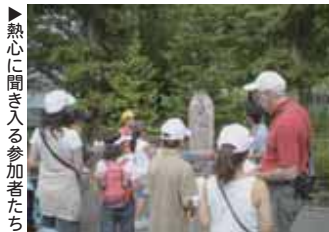
▲熱心に聞き入る参加者たち

(社)千葉県子ども会育成連合会主催の第18回広報コンクールが、5月22日に開催されました。