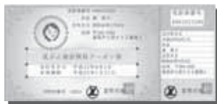
▲乳がん検診の無料クーポン券