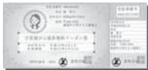
▲子宮頸がん検診の無料クーポン券