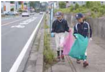
▲みんなできれいなまちに!

ごみの散乱防止と再資源化の普及啓発を目的に、5月30日に市内一斉ゴミゼロ運動を実施しました。 当日は早朝から多くのみなさんが参加し、クリーンセンターには20,180kgのごみが集められました。ご協力ありがとうございました。