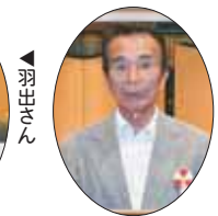
▲コスモ石油販売株セルフ 「ピ」ア富里SS三隣さん