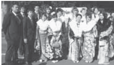
▲平成22年成人式実行委員のみなさん

市では、平成23年1月に開催(予定)する成人式を企画・運営する「成人式実行委員」を募集します。