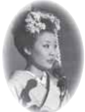
▲司会をする実行委員

■対象 平成22年4月2日～平成3年4月1日に生まれた人 ■定員 市内中学校を卒業した人で、各校から3、4人