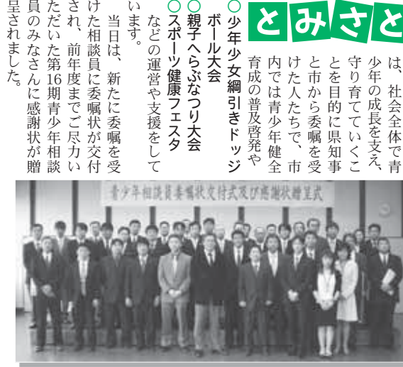
▲当日出席した第17期青少年相談委員のみなさん

4月10日、第17期青少年相談員委嘱状交付式と感謝状贈呈式が中央公民館で開催されました。 青少年相談員とは、社会全体で青少年の成長を支え、守り育てていくことを目的に県知事と市から委嘱を受けた人々で、市内では青少年健全育成の普及啓発やボール大会、親子へらぶなつり大会、スポーツ健康フェスタなどの運営や支援をしています。 当日は、新たに委嘱を受けた相談員に委嘱状が交付され、前年度までご尽力いただいた第16期青少年相談員のみなさんに感謝状が贈呈されました。