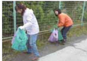
▲ポイ捨てされないまちづくりを

問い合わせ先 ●環境課リサイクル推進班 ☎(93) 4 9 4 6 ●クリーンセンター ☎(93) 4 5 2 9