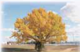
▲黄色に色づくシンボルの大イチヨウ (2009.11.28 撮影)

また、多目的広場では、各種出店や特設のミニSLなどの遊具が置かれ、約3,200人が来場し、にぎわいました。