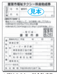
▲福祉タクシー料金融助成券

この法律では、中小企業の事業主や、住宅ローンの借り手から申込みがあった金融機関は、ほかの金融機関、政府関係金融機関、信用保証協会などと連携し、極力相手の要望に応えられるように、条件を変更するように努めることが定められています。詳しくは問い合わせください。