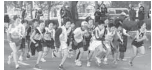
▲緊張のスタート！一番にタスキを渡すのは誰？

とみさとプラザ 2月7日、富里市駅伝大会が富里社会体育館をスタート・ゴール地点で開催されました。この大会は、小学生から大人までの35チームのほか、招待チームとして県立富里高等学校陸上競技部男女各駅伝チームが参加し、順位を競い合いました。招待チームを除く主な結果は、次の通りです。