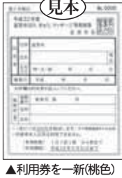
▲利用券を一新(桃色)

高年齢福祉課、日吉台出張所 市内在住の60歳以上の人が持ち物 印かん、利用者の年齢・住所が確認できるもの(健康保険証・運転免許証など)