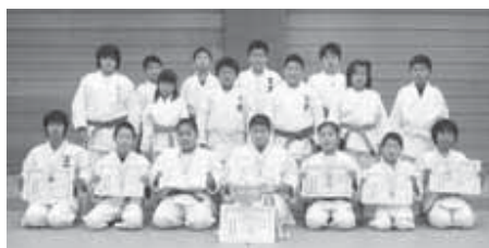
▲大活躍！富里柔道のみなさん