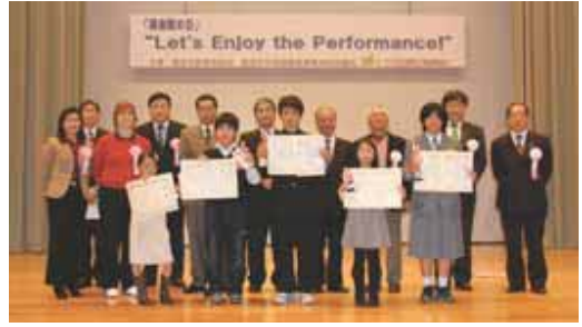
▲各部門で優秀賞に輝いたみなさん