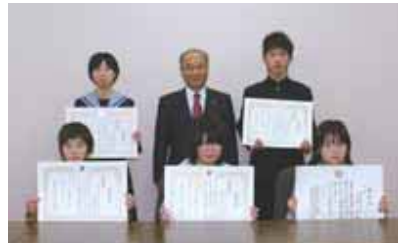
▲1月12日に表彰式が行われました