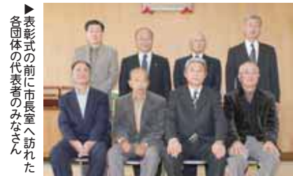
▶表彰式の前に市長室へ訪れた各団体の代表者のみなさん