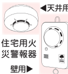
天井用住宅用火災警報器 壁用▶

平成20年6月2日から、新築・既存住宅を問わず住宅用火災警報器の設置が義務化されています。 火災の早期発見に有効な住宅用火災警報器を設置しましょう。 なお、市では、火災予防条例で「煙式(煙感知器)」の設置を定めています。 詳しくは問い合わせてください。