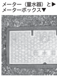
メーター(量水器)とメーターボックス

こんなときは連絡を... ○所有者が変わったとき ○水が変色したり出なくなったり