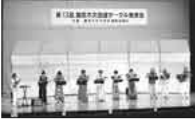
▲昨年の発表会(ウクレレ演奏)