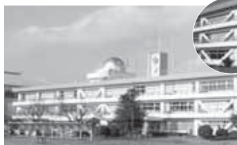
▲工事後完了の富里中学校の校舎と補強部の一部

平成21年3月から進めていた、富里中学校校舎の耐震補強・改修工事が平成21年12月に完了しました。