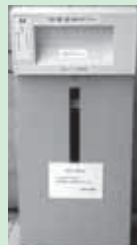
本の返却はブックポストへ