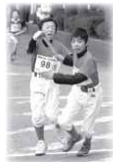
▲次は自分に任せて！

また、レース終了後にはリリーダーズ(中・高校生の団員)によるレクリエーションも行われました。主な結果は次の通りです。