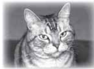
▲周りからも愛されるペットに