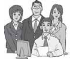
▲一緒に市の将来像や各分野の目標・施策などを検討しませんか?