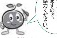
▲世界農林業センサスマスコットキャラクター「つっちー」