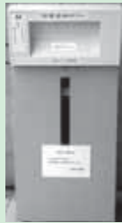
▲本の返却はブックポストへ