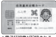
▲電子証明書が記録される住基カード

②電子証明書の申請 場所：本庁舎1階市民課窓口 持ち物：住基カード、官公署が発行した顔写真付きの身分