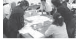
▲議論する委員のみなさん

この会議では、各委員が生活・環境や産業・経済を検討する「まちづくり班」と、健康・医療・福祉や教育・文化を検討する「くらしづくり班」の2班に分かれ、約半年にわたり意見交換を行い、その結果を「これからのとみさとについて」と題した提言書としてまとめました。