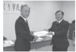
▲大久保敏久市長(右)から市長へ手渡されました

なお、この提言書は、市ホームページや企画課窓口でも閲覧できます。また、市ホームページでは全6回にわたるまちづくり市民会議の様子が掲載されています。