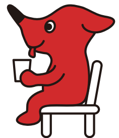
千葉県マスコットキャラクター 「チーバくん」