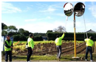
役割分担で安全に磨きます

コロナの影響で、年2回の活動が1回に制限されたが、10月に今年最初の活動をした。もともと少人数作業であることと、屋外の作業なので基本的な対策以外はいつも通り。安全を守るカーブミラー清掃なので活動は継続して行っていく。