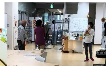
センター内で撮影タイム