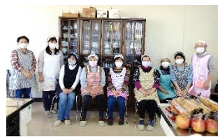
おいしいカレーを作ります

1回の子ども食堂を2部制に分け、1回の定員を15名として密にならないようにしている。