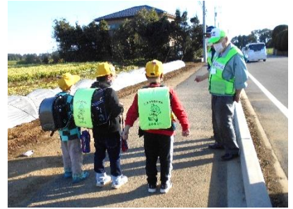
登下校中の子どもたちへの声かけ

この地域に限らず、高齢化は進んでいます。目下の課題は、構成メンバーに若い世代を増やしていく事ですが、空き家問題や、地域に住む外国人とのコミュニケーションも含め、地域の皆さんと話し合っていきたいと考えています。連絡協議会という大きな組織ですが、日頃から各地区が問題解決できるような仕組み作りも必要だと思っています。今後、新たな担い手や資金作りの方法も、連絡協議会で提案、情報交換など行っていきます。