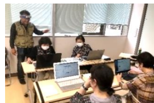
会員どうしの距離感も以前に比べたら縮んできました

サポートセンターが再開した6月より活動を再開。ソーシャルディスタンスを徹底し、講師もフェイスシールドを着用している。これからも活動を継続できるよう、オンライン講座にも挑戦していく。