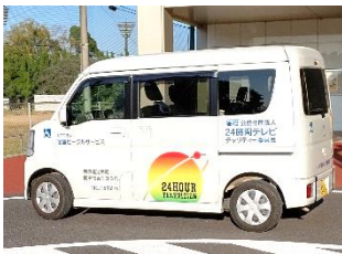
24時間テレビから贈呈された送迎用車両

乗車中は、ドライバーも利用者也マスクを着用し、会話を控えるなどの対策を取っている。