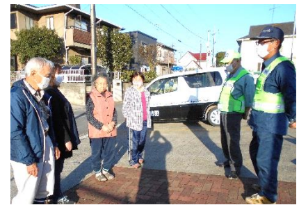
地域の方々との交流も大事な役目