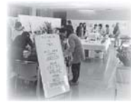
■生涯学習課文化資源活用室 ☎(93)7641

○各種教室は、正午～午後1時まで昼休みです。○申込みは、時間に余裕をもってするようお願いします。 ※押し花体験教室は、材料が無くなり次第受付終了です。