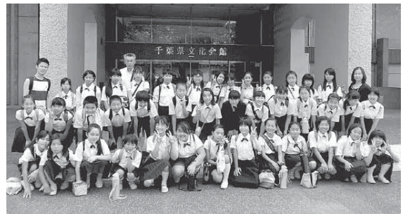
▲金賞受賞後の富里小学校合唱部の皆さん

その結果、千葉県代表として9月6日にソニックシティ大ホール（埼玉県さいたま市）で開催された関東甲信越ブロックコンクールに出場し、奨励賞を受賞しました。