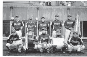
▲ブルーオーシャンズの皆さん