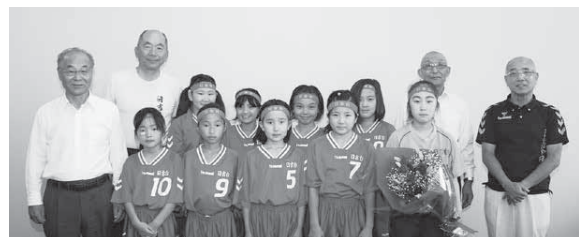
▲左から相川市長、日吉台ハンドボールクラブの皆さんと國本教育長