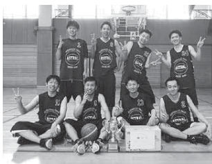
▲男子の部優勝アストラルの皆さん