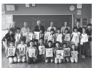
▲マイバッグを使ってごみの減量化に貢献!

6月24日、富里第一小学校で4年生の児童を対象に、環境学習出前講座が行われました。