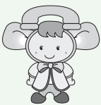
▲消費生活センター マスコットキャラクター「とみりん」

消費生活センターでは、消費者の皆さんからの商品・サービスや契約など消費生活全般に関する苦情や問い合わせに専門の相談員が応じます。 日時：月～金曜日 （祝日、年末年始を除く） 午前10時～正午／ 午後1時～4時 場所：市役所分庁舎2階