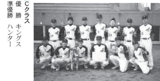
▲優勝カップを手に勝利を喜ぶ七栄レジャースの皆さん

市春季野球大会が、3 月 24 日～5 月 5 日の間、富里中央公園野球場・市営野球場を会場に開催されました。 今大会は、A クラス 16 チーム、B クラス 15 チーム、C クラス 18 チームが参加。各クラスで熱戦が繰り広げられ、選手たちは日ごろの練習の成果を競い合いました。 各クラスの上位結果は次の通りです。