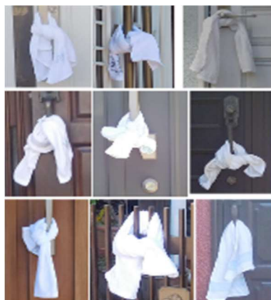
玄関ドア付近に 白いタオル