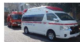
富里市消防本部には多大な協力をいただきました。