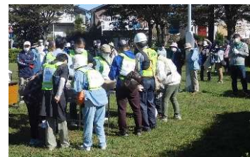
各自治会の一次避難場所