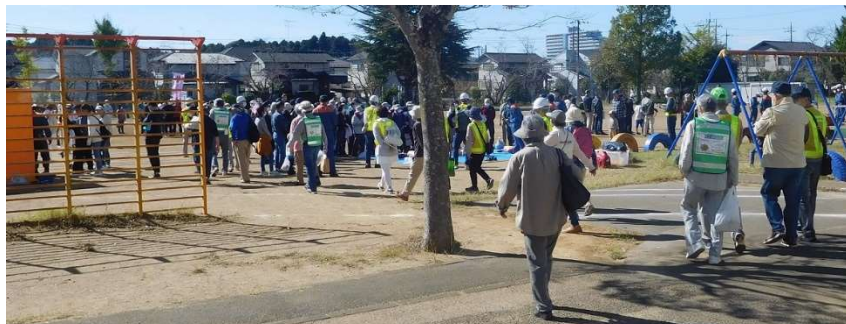
指定避難所の日吉台小学校へ集結