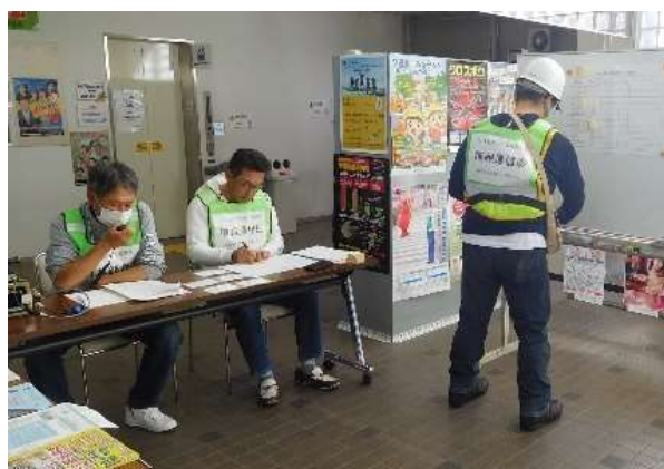
防災連合会の地区対策本部(コミセン)