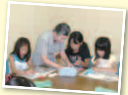
▶好評だったちぎり絵教室

市では、いつでも、どこでも、誰でもが共に学び合うまちづくりを目指し、市民一人ひとりの生涯学習を支援する「生涯学習アシスト事業」を実施しています。 「何かを学びたい、でも指導してくれる人がいないから学べない」というときに、登録をした「生涯学習アドバイザー」がボランティアで指導します。アドバイス内容は次の通り、あらゆる分野を対象としています。詳しくは問い合わせてください。