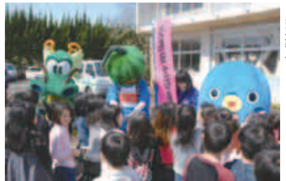
▶うなりくんやドラムと協力して交通安全をPR