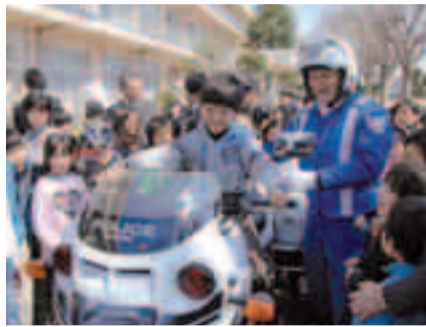
▲白パイの体験乗車は大人気!

4月6日(土)15日の「春の全国交通安全運動」に先駆けて、4月5日に富里小学校でメッセージ伝達式が開催されました。 相川市長から児童に向けての交通安全メッセージや児童代表による交通安全宣言が行われ、約650人の児童へ交通安全を呼びかけました。 また、伝達式終了後には校庭で白バイなどの警察車両の見学や、富里市・成田市・栄町の各キャラクターとの触れあいの時間が設けられました。