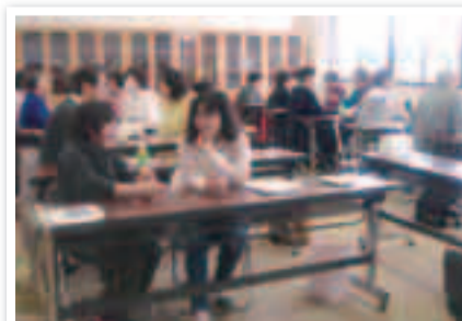
▲研修では2人1組で実技を学びました