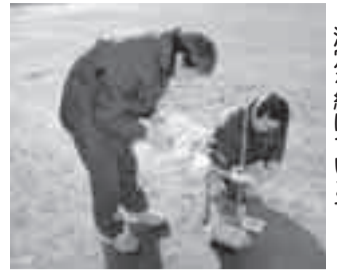
市内小・中学校や幼稚園、保育園では昨年5月から測定を続けています

子どもたちの安全を考え、低減基準を超えた幼稚園、保育園、小・中学校、公園などの公共施設を優先して、放射線量の低減対策に取り組みます。