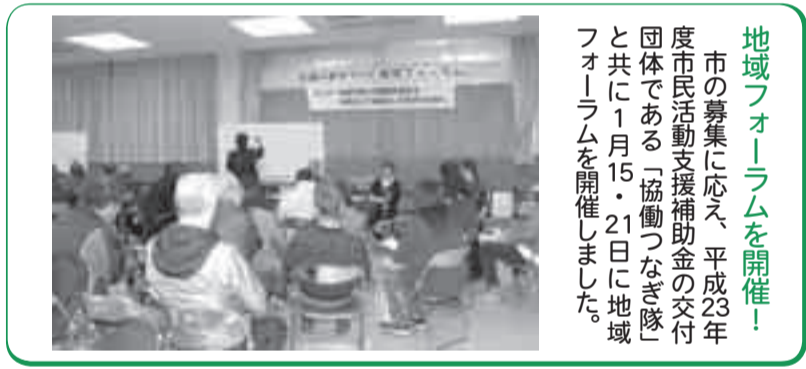
地域フォーラムを開催！ 市の募集に応え、平成23年度市民活動支援補助金の交付団体である「協働つなぎ隊」と共に1月15・21日に地域フォーラムを開催しました。

平成24年度「市民活動支援補助金」を募集します 市では協働のまちづくりを目指して、自主的・自発的に行う公益的な活動を行う団体(市民活動団体)を支援しています。 市民活動推進課市民協働推進班 ☎(93) 11117