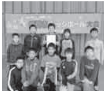
▲覇者「富小マスターズ」!