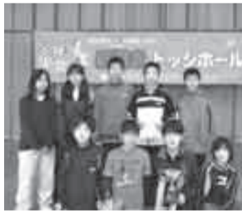
▲「ビクトリー」の勇士たち!