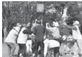
◀接戦を制した立沢台若草会の皆さん