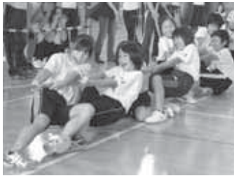
◀チームワークでヨイショ！