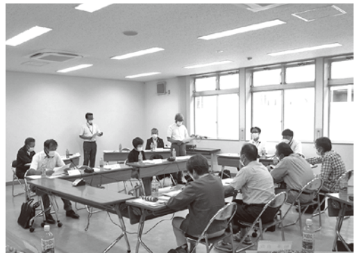
法律と制度の改正には特に集中して

「人・農地関連施策の見直し」の研修では、令和4年5月に改正された農業経営基盤強化法等の概要をはじめ、農地利用の最適化の推進について研修を受けました。法律の改正により、日常的な農地の見守り活動や相談活動に加え、将来に向けた農家