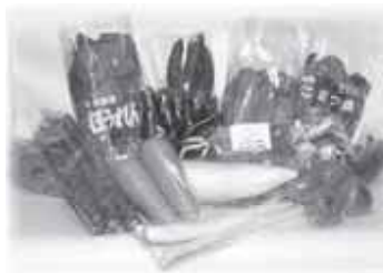
◀新鮮野菜をプレゼント！