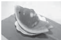
▲▲宝石箱の中には、すいかとメロンの果肉がいっぱい！