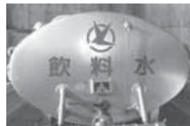
▲一度に1tの水を運ぶことができます

この訓練は、災害などの水道施設事故の発生時に連絡や応急対策を速やかに行うことを目的としています。当日は、一斉に県防災無線で指示し、指定された場所に到達するまでの時間や補水作業、応急給水作業の操作確認をしました。