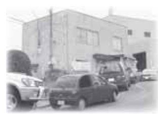
▲混雑時を避けて搬入を！