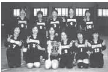
▲優勝した富里クラブのみなさん

10月30日、富里社会体育館を会場に、第26回富里市家庭婦人バレーボール秋季大会が開催されました。6チームが参加して行われたこの大会では、各コートで白熱した試合が展開されました。出場した選手たちのさわやかな汗とともに、会場は熱気に包まれていました。主な結果は次の通りです。