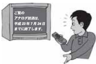
▲地デジの準備はお済みですか?

◆ 地上デジタル放送の準備をしたのに 映らないときは? ◆ 地上デジタル放送の準備を済ませても、地形や電波の状態などで、良好にテレビを視聴できないことがあります。