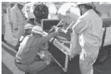
▲応急給水作業の確認をする職員

11月18日、富里市役所駐車場を会場に、印旛郡内の水道事業者(7市1町1企業団1団体)合同による印旛ブロック管内水道災害対策訓練が実施されました。