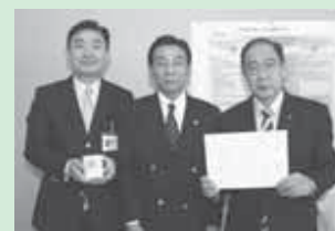
▲水橋会長(中央)からマグカップが贈呈されました

ブックトリップ事業に賛同いただいた富里ライオンズクラブから、記念品としてマグカップが奇贈されました。