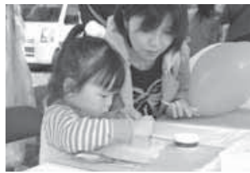
▲お母さんと世界に1つのペンダント作りうまく作れたかな？

リサイクルフェアでは、廃ガス管を再利用した“リサイクルペンダント”作りが子どもたちに一番人気。色とりどりのオリジナルアクセサリーがたくさんできまりました。 また、健康まつりでは、筋力アップ体操体験など、健康づくりに役立つ催しが行われたほか、地区保健推進員特製の富里の特産にんじんを使用した栄養たっぷり“キャロットゼリー”に多くの人が舌鼓を打ちました。