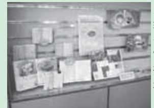
▲破れていたり、マーカーで塗りつぶされた本も！