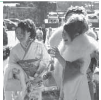
図 生涯学習課社会教育班 ☎(93) 7641