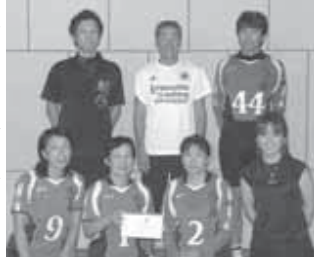
▼ひまわりBのみなさん