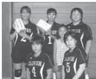
▼クローバーのみなさん