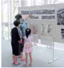
原爆のことは何度もTVや本、映画などで目にしました。

私は原爆の写真を見て、何で戦争をするのかと。命を落とす人、命を落とさなくても後遺症が残った人もいてかわいそうだと思います。(12歳・女)