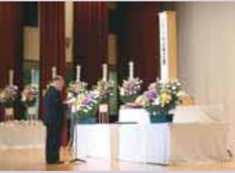
☎ 社会福祉課厚生班 ☎(93) 4192 FAX(93) 2215