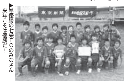
▶準優勝の七栄FCのみなさん。来年こそは優勝だ!