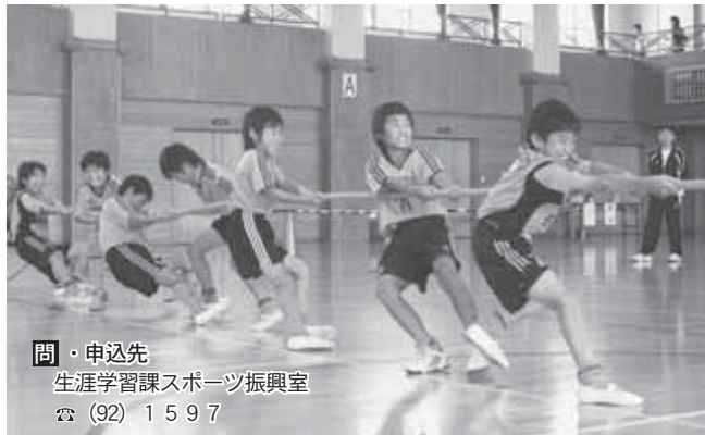
間・申込先 生涯学習課スポーツ振興室 ☎(92)1597