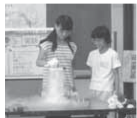
▶環境実験では、液体窒素を使って氷の世界を体験