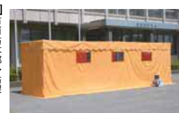
▲人体に無害な煙がハウス内に充満します

各区・自治会などでは、地域で毎年防災訓練を実施しています。積極的に参加して、災害時の行動を体得しましょう。