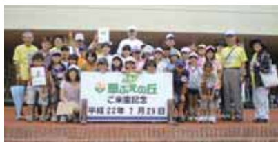
▲参加したみなさん

このイベントは、小学生を対象に「英会話の日」の行事の一環として行われたもので、参加した小学4～6年生（25人）は、「Let's Try English（英語にチャレンジ）」を合言葉に、外国人講師とともに、ネイチャーウォークをはじめ、キャンプファイヤーなどを楽しみました。