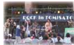
▲大盛り上がりロックイン富里！

第36回富里ふるさとまつりが8月7日、富里中学校グラウンドで開催されました。当日は天気にも恵まれ、ライトアップされたやぐらの上