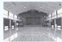
▲新しく生まれ変わった体育館

学校関係者や利用者のみならず、ご不便をおかけしていましたが、たくさんの人のご協力により、より安全な体育館に生まれ変わりました。