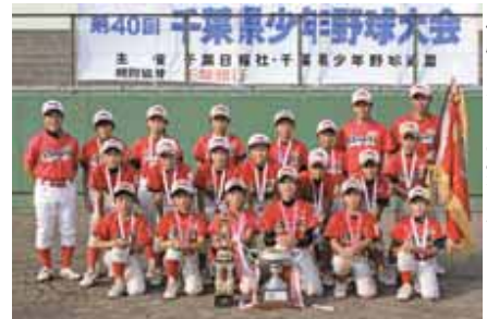
▲優勝したチームのみなさん

第40回千葉県少年野球大会（千葉日報杯争奪戦）の決勝戦が、8月15日、成田市営大谷津球場で開催され、富里ラディソンエンゼルス（市スポーツ少年団加盟）が見事、初優勝に輝きました。 この大会は、県内の各予選を勝ち抜いてきた強豪64チームが出場。同チームは、5月に開催された印旛郡市少年野球大会（41チーム参加）で3位入賞を果たし、この大会の出場権を取得しました。決勝戦では、チームが一丸となり、日ごろの練習成果を発揮。見事、初優勝の栄冠を手にすることができました。 なお、表彰された選手は次の通りです。