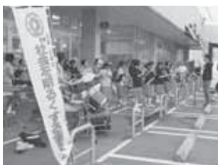
▲昨年行われた演奏会の様子

社会を明るくする運動とは… 犯罪や非行の防止と、罪を犯した人の更生について理解を深め、犯罪や非行のない明るい社会を築くことを目的に、全国規模で実施する運動です。