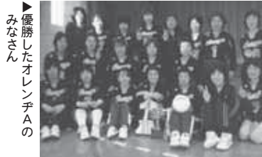
優勝したオレンチAのみなさん